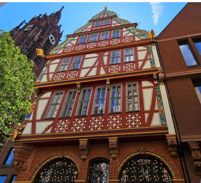
Auch am Dom-Römer-Projekt in Frankfurt waren die Liemer maßgeblich beteiligt. Bei der Rekonstruktion der Goldenen Waage waren sie für alle Holzarbeiten zuständig.

Geht nicht, gibt es nicht bei dem wachsenden Spezialistenteam aus Lieme. „Was nicht restauriert werden kann, rekonstruieren wir“, lautet das Motto. Dabei ist Kramp & Kramp keine Aufgabe zu groß, aber auch keine zu klein. Entscheidend sei der Anspruch, bei jedem Auftrag echte Wertarbeit abzuliefern. Historische Werte zu bewahren, ist ihre Berufung. (sc)