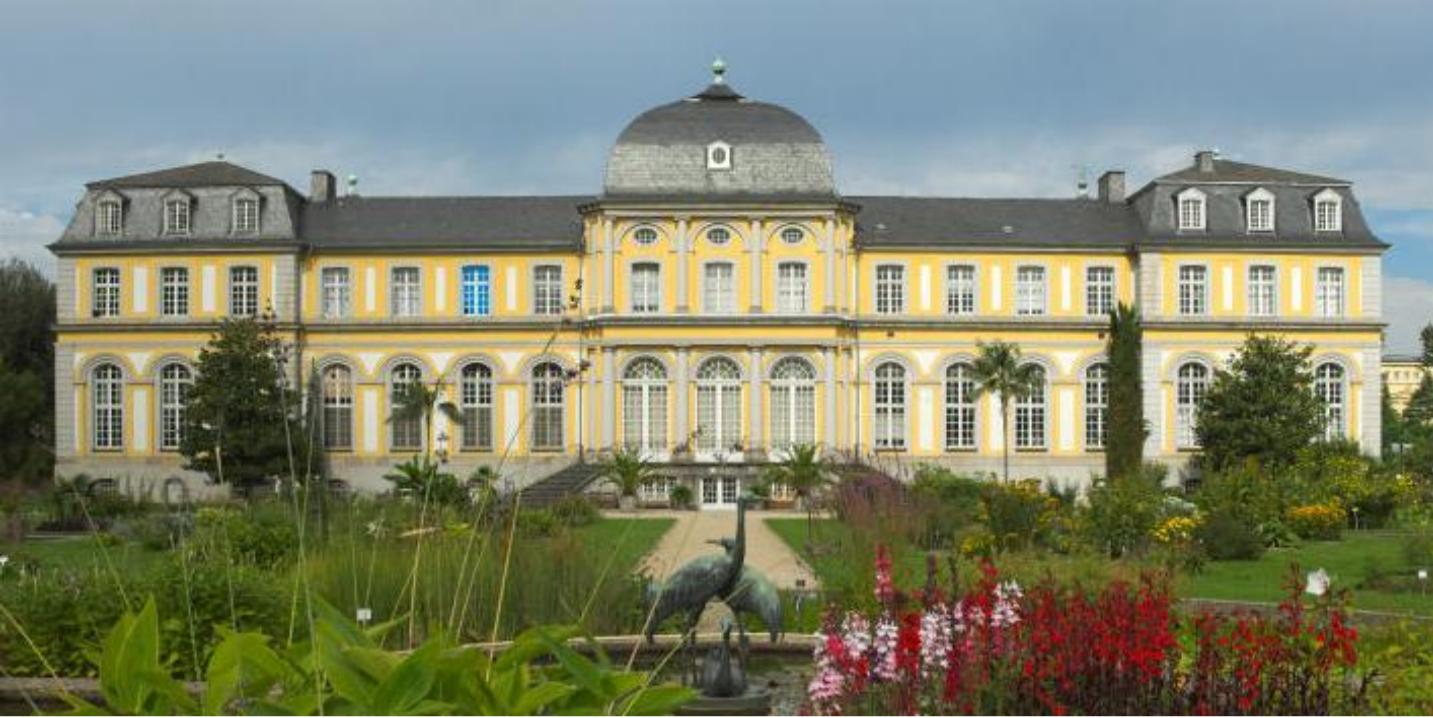
Das Poppelsdorfer Schloss in Bonn gehört zu den außergewöhnlichsten Projekten in der Firmenhistorie von Kramp & Kramp. Hier mussten allein 450 Fenster restauriert werden.