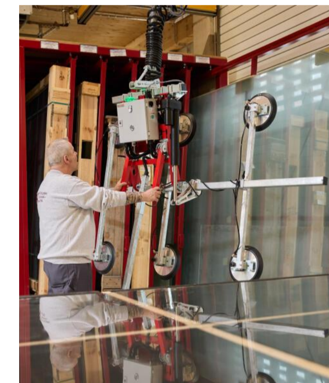
Eine Kranbahn ermöglicht es, riesige Glasscheiben mit einem Vakuumsauger zum Glasschneidetisch zu transportieren.

Alle Neuerungen verbessern zudem die Arbeitsbedingungen der Mitarbeitenden. Farbnebel und Schadstoffe, die bei der täglichen Arbeit entstehen, werden von einer leistungsstarken Anlage aufgesaugt und gefiltert. Eine große Luftwechselanlage sorgt für einen fünfmaligen Luftaustausch pro Stunde und schafft eine gesunde Umgebung. Mit integriert wurde zudem ein Entsorgungslager, um