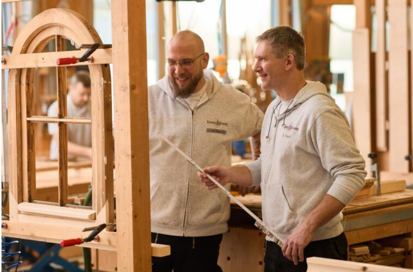
Fenster und Türen werden zunächst in der Werkstatt entglast. Die Restaurierungen am Holz übernimmt anschließend nebenan die Tischlerei. Auf dem Betriebsgelände in Lieme arbeiten alle Gewerke Hand in Hand.

Herzlichen Glückwunsch zum 60-jährigen Firmenjubiläum