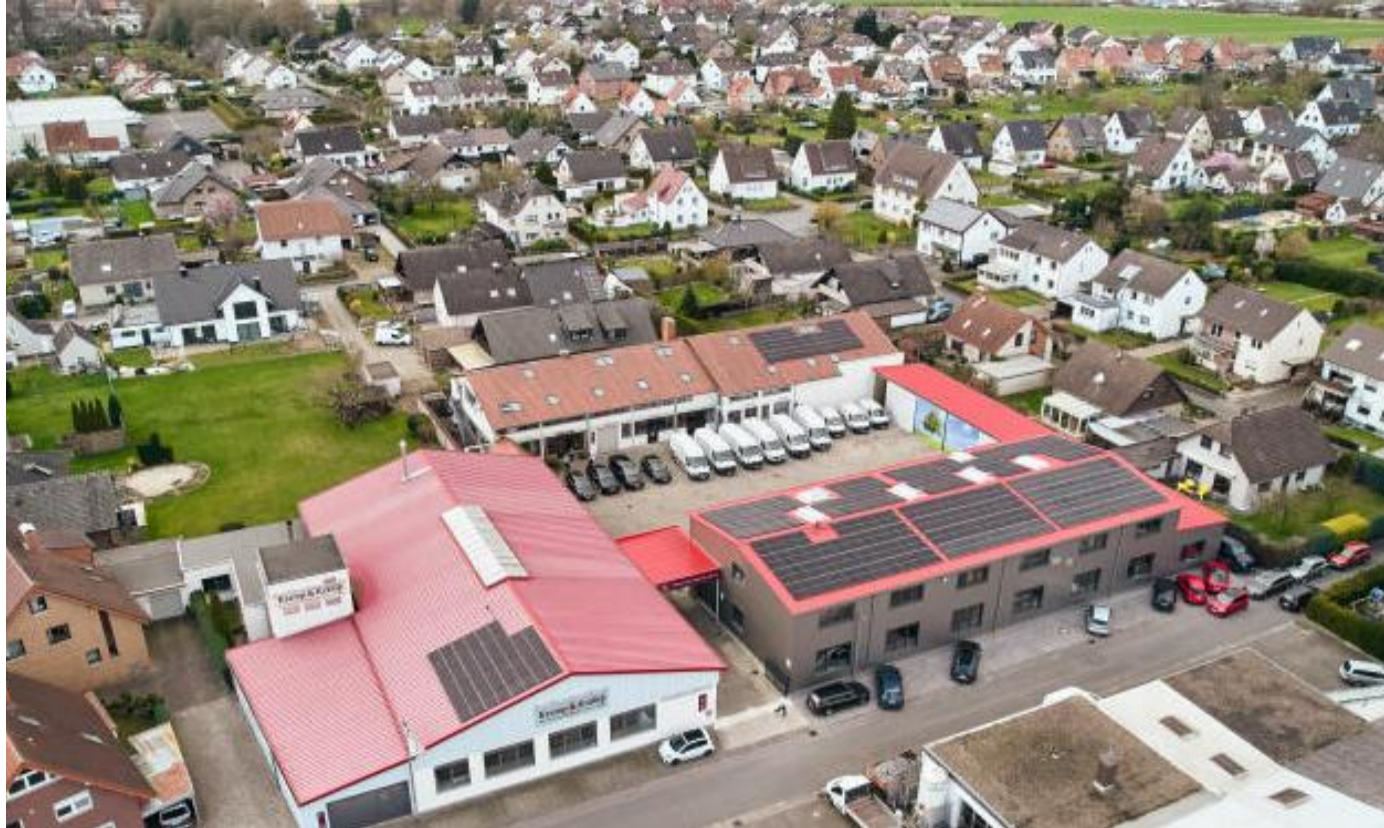
Das Luftbild zeigt das Firmengelände von Kramp & Kramp inklusive des Neubaus (vorne rechts). Alle Fachrichtungen haben damit die besten räumlichen und technischen Voraussetzungen für ihr Handwerk.

Fax: 0 52 02 / 99 24 21 Mail: info@beton-werk-grete.de www.beton-werk-grete.de