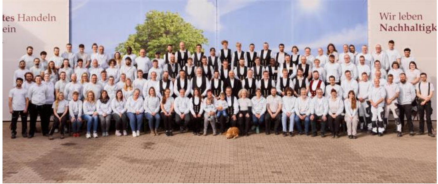
116 Menschen arbeiten aktuell in Lieme – darunter sechs Restauratoren im Handwerk, 14 Techniker für Denkmalpflege und Handwerksmeister, 65 Facharbeiter, sieben kaufmännische Mitarbeiter und Ingenieure, zehn Bauhelfer und 14 Auszubildende.

05261 - 6251 INFO@DRECHSLEREI-NEUMANN.DE